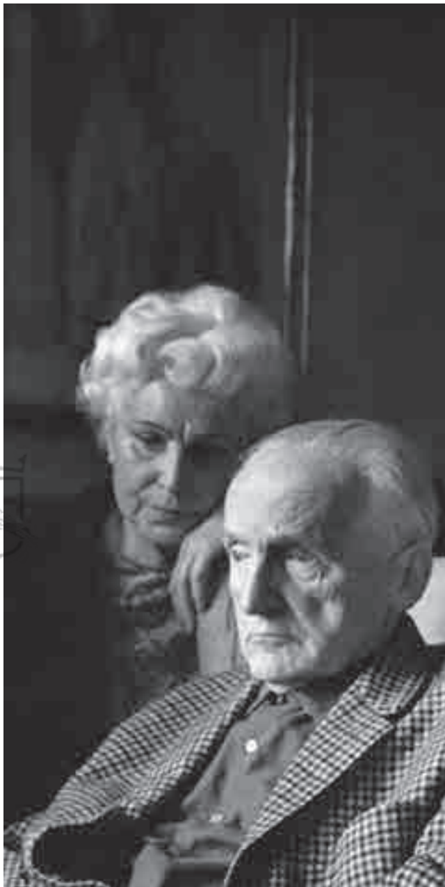
Kettesben feleségével: „Engem is megszelidített”

OTTHONA ÉLETE UTOLSÓ ÉVTIZEDÉBEN is nyitva állt a művészbarátok, Weöres Sándor, Illyés Gyula, Pilinszky János, Nagy László és a többiek előtt. Mindig frissen borotváltan fogadta őket, karosszékében ülve, könnyedén megkötött selyemkendővel a frissen vasalt inge nyitott gallérja mögött. Többnyire Mozart vagy Bartók zenéjét hallgatta, s közben érdeklődve figyelte a beszámolókat. Betegségére csak egy-két kötőszóval álló rövid közbevetései utaltak. 1967 késő tavaszán felesége nyaralni vitte volna, már össze voltak pakolva. Ferenczy Béni egyszer csak ép bal kezével a hasára mutatva jelezte, hogy valami baj van. A mentőben derült ki, hogy perforált a vakbele, azonnal műteni kellett. Műtét közben agyembóliát kapott, és tizenegy napnyi szenvedés után a kórházban meghalt. 77 éves volt, felesége 33 évvel élte túl. „Ő mindenség-szelidítő mester volt, ahogy Illyés Gyula leírta – mondta halála előtt férjéről. – Engem is megszelidített.” A magyar szobrászat egyik legfontosabb alakjáról, aki művészként, emberként is példászerű életet élt, a halála óta eltelt fél évszázad alatt nem született részletes életrajz vagy monográfia.