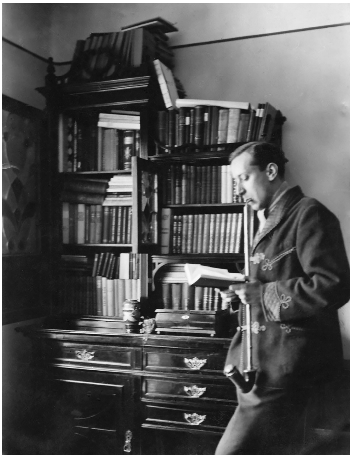
Apám tajtékipával, 1935 körül

vagy Gyulai Pál Éji látogatás című szentimentális verse, amit anyám emlékezetből tudott. Belém ivódott, nem véletlenül, a cserbenhagyottság, a megjelöltség és a halálközelség tudata. „ Három árva sír magában, / elhagyott, sötét szobában / zivataros sötét éj van / édesanyjuk kinn a sírban ”