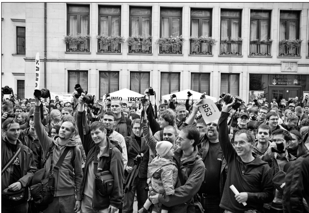
Tavaly több mint ötszáz fotós érkezett Pozsonyba, a hazaiakon és a cseheken kívül Spanyolországból, Németországból és Dél-Koreából

A zsűri által kiválasztott legjobb alkotások közös tárlaton szerepelnek majd Pozsony, Budapest s Berlin kiállítótermeiben. A nap folyamán fotókurzusok, előadások, vetítések és workshopok is várják az érdeklődőket, este pedig két ingyenes koncerttel örvendeztetik meg a résztvevőket és a közönséget a szervezők. A helyszínen, azaz a Tyrš rakparton 20.30-kor a csehek nagy kedvence, Dan Bárta lép színpadra. A rendkívül sokoldalú énekes ezúttal Illustratosphere nevű jazz-zenekarával érkezik, és nem véletlenül iktatta be csehországi turnéjának szünetnapján ezt a fellépést, hiszen a nap során fotós-ként is bemutatkozik: kiállításá